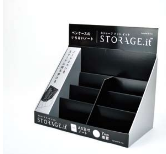
③ダンボール店頭ディスプレイ 小