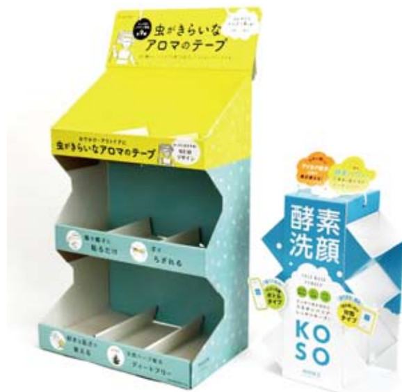
①ダンボール吊り下げディスプレイ