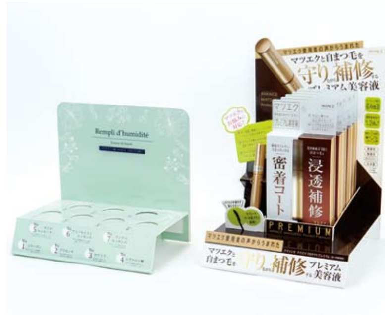
②Vカットディスプレイ